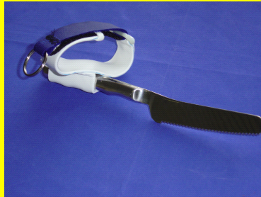
Adaption zum Halten des Messers bei Funktionshand